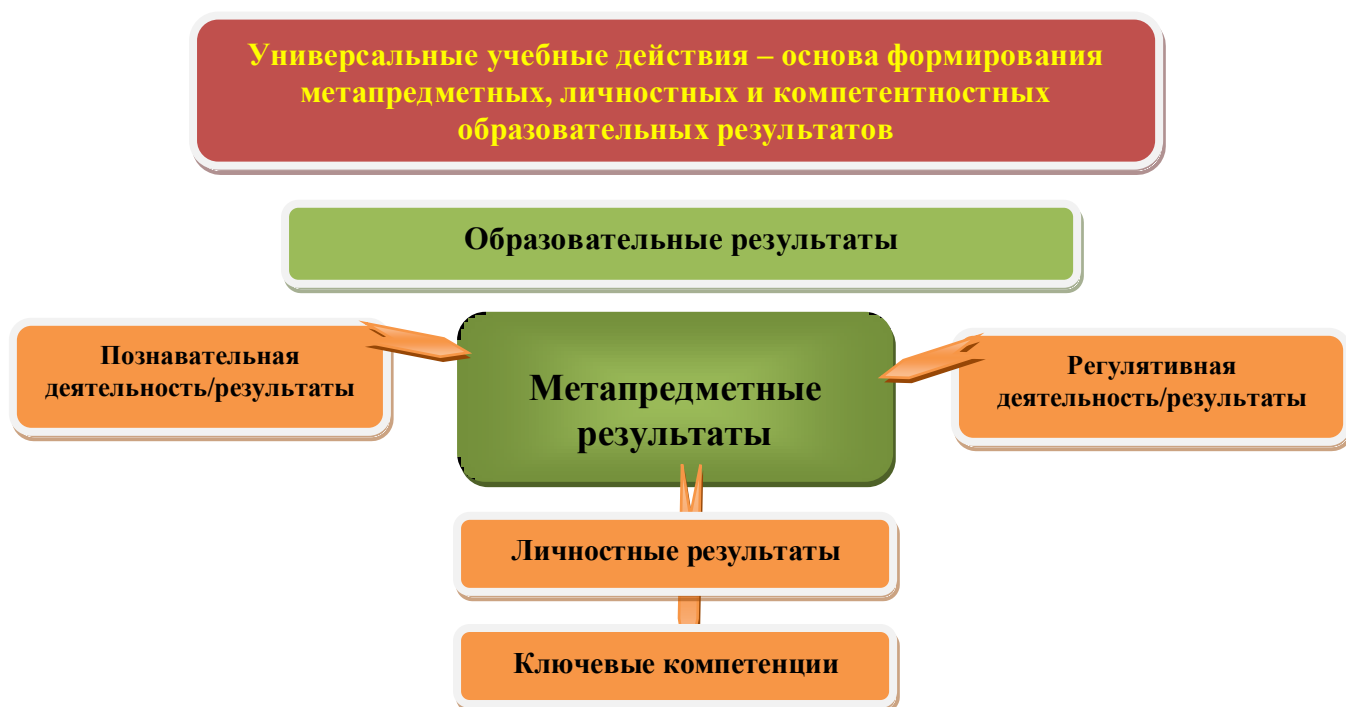
Рис. 3. Система оценки образовательных результатов

Интерпретация результатов оценки ведётся на основе контекстной информации об условиях и особенностях деятельности субъектов образовательного процесса. В частности, итоговая оценка обучающихся определяется с учётом их стартового уровня и динамики образовательных достижений.