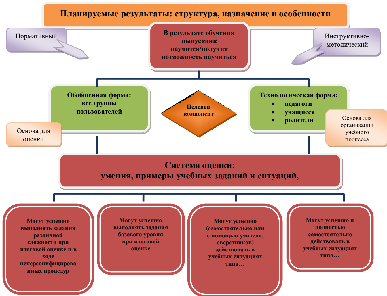
Рис. 1. Особенности структуры планируемых результатов. Функция и назначение.

Система оценки достижения планируемых результатов освоения основной образовательной программы основного общего образования: